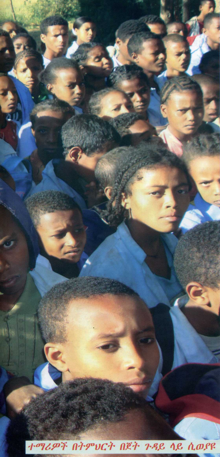
ተማሪዎች በትምህርት በጀት ጉዳይ ላይ ሲወያዩ

ማሰራጨትና በጀት ማዘጋጀትና የየአካላቱን ድርሻ፣ የስራ ሃላፊነትና የበጀት ምንጭ እስከመግለፅ ድረስ የሚሳተፍበት ሂደት ነው።