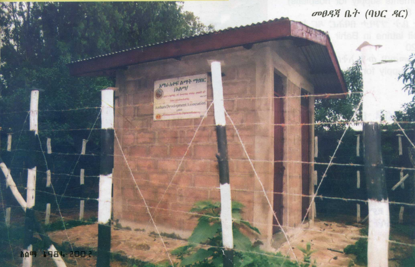
መፀዳጃ ቤት (ባህር ዳር)