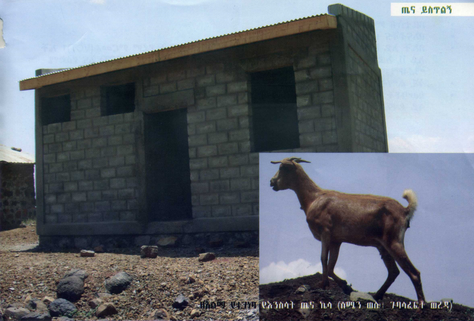
ዘአልማ ህክምና ዩኒቨርሲቲ የአንስሳት ጤና ኪሳ (ሰሜን ጠዕ: ገባሳጊፎተ ጠረዳ)