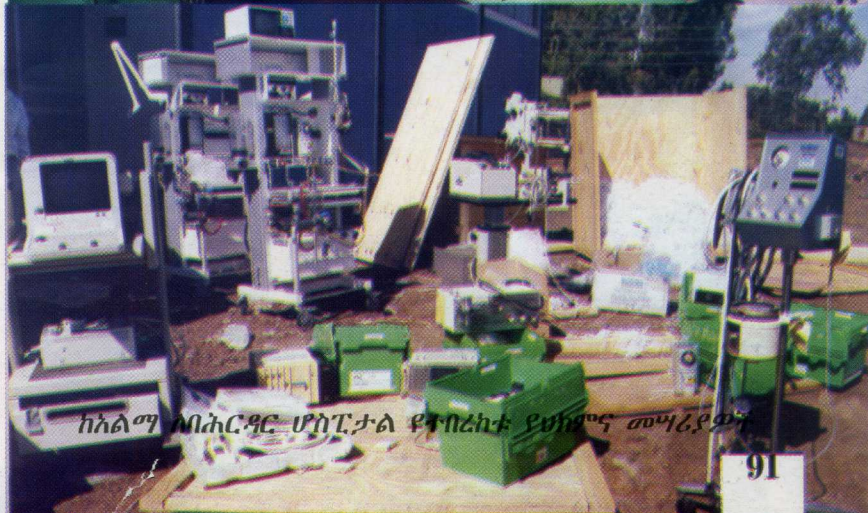
ከአልማ ለባሕር ዳር ሆስፒታል የተበረከቱ የህክምና መሣሪያዎች

ከ1992 ዓ.ም. ጀምሮም ይህንኑ አጠናክሮ በመቀጠል በክልላችን በሚገኙ 102 ወረዳዎች ውስጥ:-