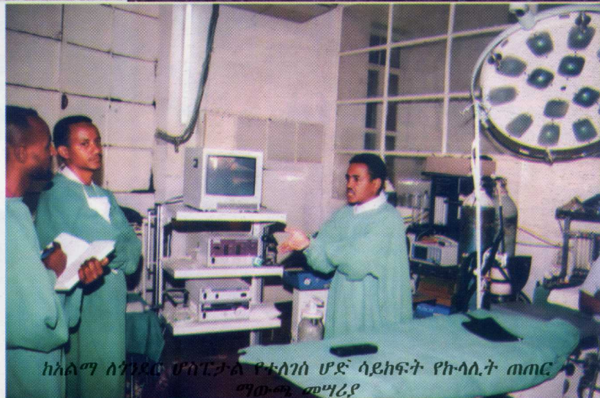
ከአልማ ለጎንደር ሆስፒታል የተለገሰ ሆኖ ሳይከፍት የኩላሊት ጠጠር ማውጫ መሣሪያ