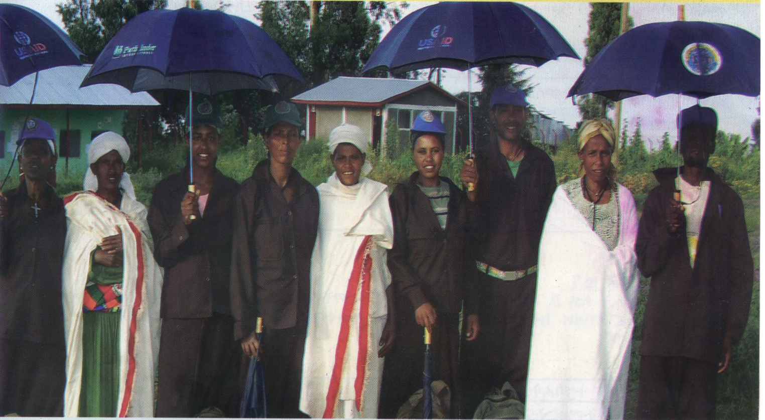
የአልማ የተዋልዶ ጤና አገልግሎት ወኪሎች ከአገልግሎቱ ተጠቃሚ አርሶ አደር ሴቶች ጋር